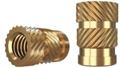
Messing | metrisches Gewinde